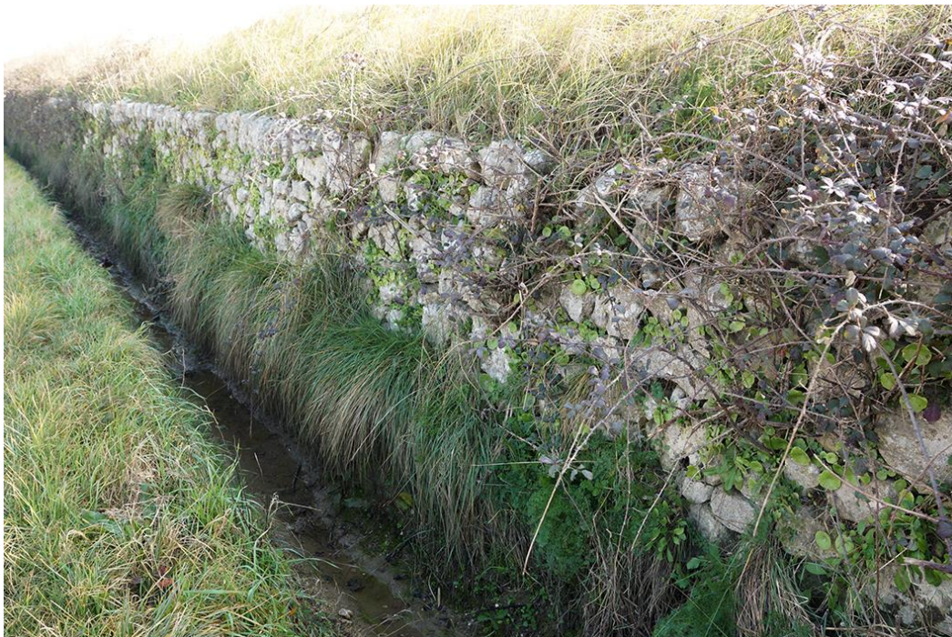
Un mur de soutènement agricole le long d'une route ; Sainte-Anastasie (Gard)

Le petit patrimoine en pierre sèche des XVIII e et XIX e siècles est omniprésent sur le territoire de la réserve de biosphère. Murs, béals, aiguiers, enclos, chemins, charbonnières, fours à chaux sans oublier les innombrables capitelles qui parsèment la garrigue témoignent d'un temps où la pierre sèche était un outil de production indispensable à la vie quotidienne.